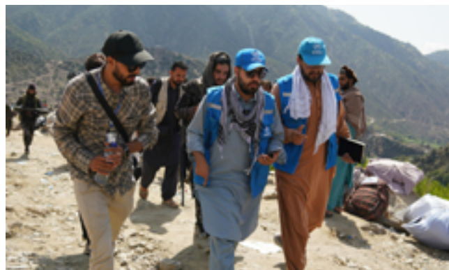
Ett team från UNHCR rekar omfattningen av skadorna efter jordbävningen i september 2025.

Vagabond Shoemakers Foundation har sedan de bildades 2023 bidragit med stora belopp till människor på flykt. Under 2025 bidrog de till Afghanistan, Sudan och även icke öronmärkta pengar. Men redan innan stiftelsen skapades har Vagabond International bidragit med generösa belopp sedan 2017.