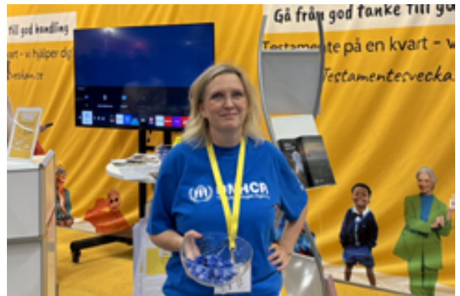
Vi deltar på Seniormässan i oktober för att öka kännedomen om möjligheten att skänka pengar via testamente.

att det gått tio år sedan massflykten från kriget i Syrien. Kampanjstarten skedde på årsdagen av publiceringen i media av bilden på den lille dode pojken på en strand i Medelhavet, en publicering som väckte en våg av engagemang för flyktingar i Sverige. Totalt 23 miljoner kronor (19) användes under 2025 för att öka medvetenheten och engagemanget för flyktingar. Genom att utnyttja sociala medier, digitala kampanjer och andra online-plattformar strävar vi efter att öka medvetenheten och engagemanget kring UNHCR:s arbete.