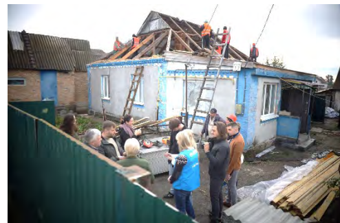
En familj i Ukraina får sitt förstörda hus reparerat.