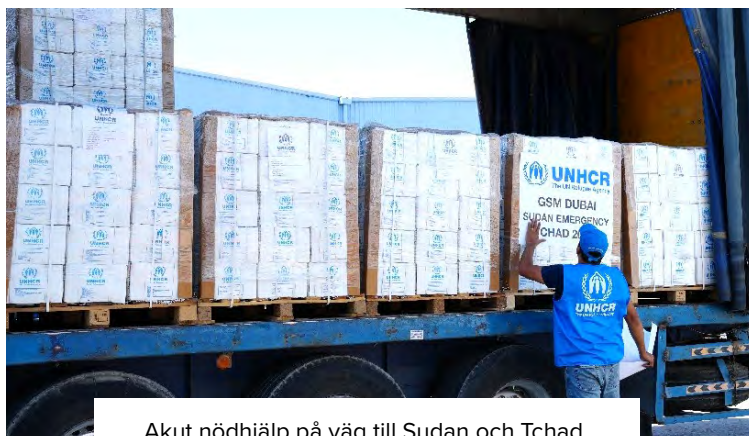
Akut nödhjälp på väg till Sudan och Tchad.