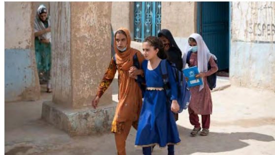
Flickor på väg till skolan i New Saranan refugee village, Balochistan, Pakistan. De kan gå i skolan tack vare UNHCR:s skolprogram Primary Impact.