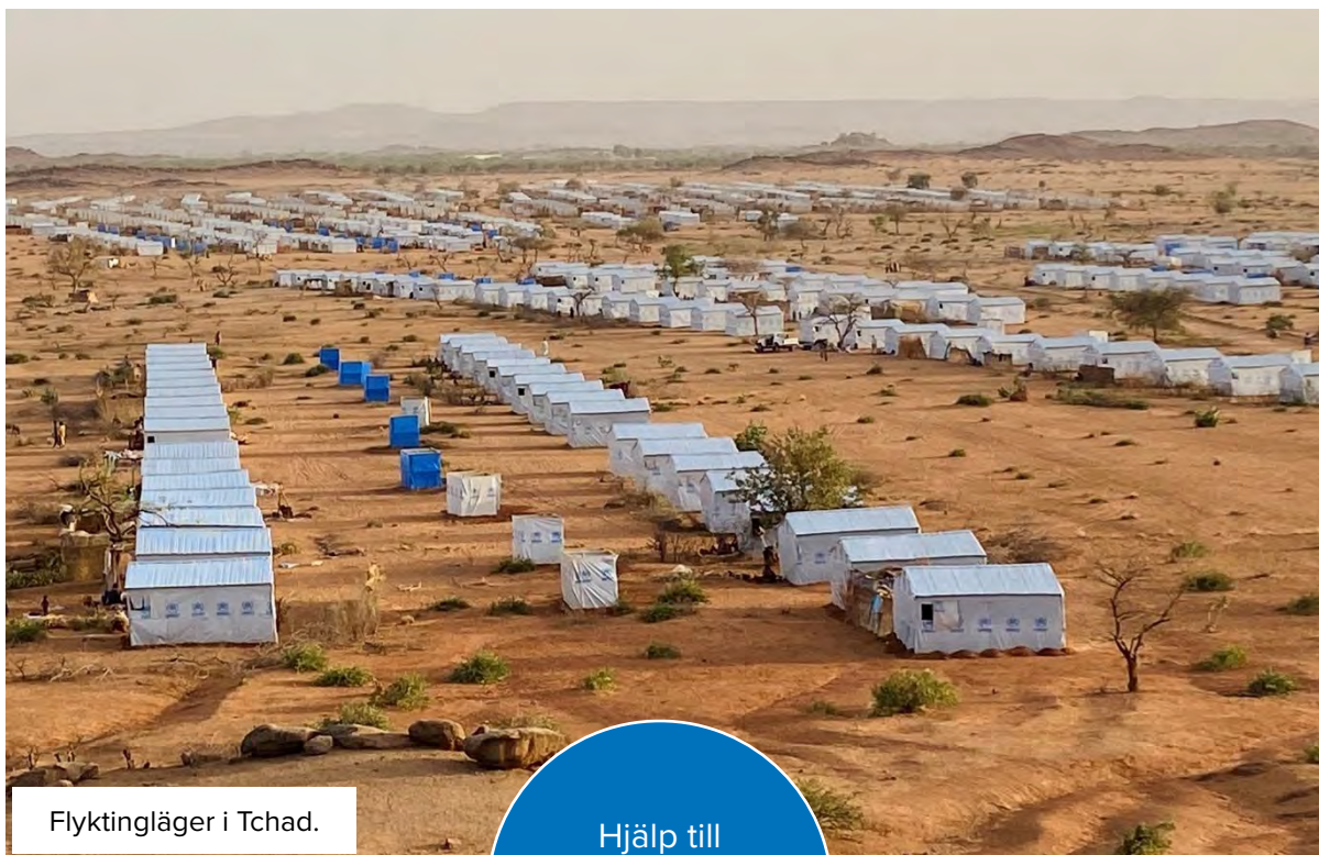
Flyktingläger i Tchad.