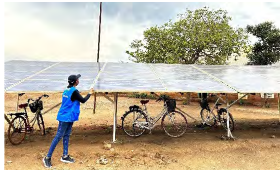
Solceller installeras i Tanzania.