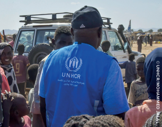
Många flydde våldet i Sudan och sökte sig till UNHCR:s uppsamlingsläger.